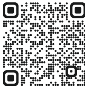
Gambar 2. QR Code Peraturan Rektor UNAND terkait MBKM