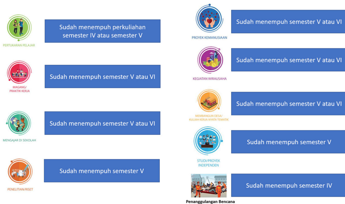
Gambar 1. Persyaratan Studi Mahasiswa yang Mengikuti Program MBKM

Program Merdeka Belajar – Kampus Merdeka (MBKM) resmi diluncurkan oleh Menteri Pendidikan dan Kebudayaan pada awal tahun 2020 melalui beberapa peraturan. Program MBKM diharapkan dapat menjawab tantangan Perguruan Tinggi untuk menghasilkan lulusan yang sesuai perkembangan zaman, kemajuan IPTEK, tuntutan dunia usaha dan dunia industri, maupun dinamika masyarakat. Program MBKM yang diluncurkan oleh Kementerian terdiri 8 (delapan) program yang kesemuanya memberikan hak kepada mahasiswa untuk belajar di luar program studi maksimum 3 (tiga) semester setara maksimum 60 sks. Mahasiswa yang akan mengambil program MBKM sudah menempuh studi pada semester tertentu sesuai pada Gambar 1. Ketentuan program MBKM pada setiap skema kegiatan mengacu kepada peraturan rektor yang tertera pada QR di Gambar 2.